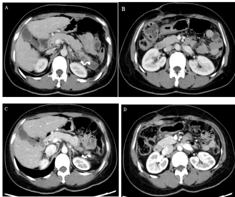
图3. 患者术后40日 (A、B) 及术后4月 (C、D) 影像学检查未见肾静脉血栓、脾静脉血栓较前减少。